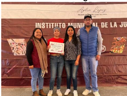
Imagen 1.- Instituto Municipal de la Juventud.

En términos generales, el programa cuenta con mecanismos funcionales para identificar a su población objetivo, sustentados en criterios demográficos y territoriales, así como en procesos administrativos de registro y validación.